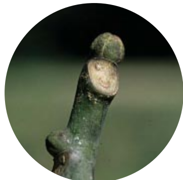
【カラスザンショウ】