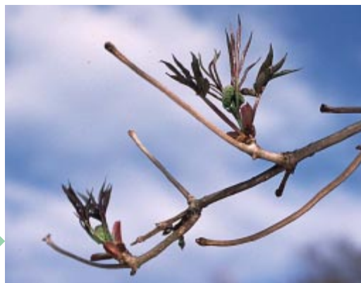
【ニワトコ】の芽ぶくようす。

オータムコンサート 13日(日)ふれあいドーム 相模原音楽家連盟によるトランペット演奏などによる楽しいコンサートです。 午後1時30分～午後2時と午後2時30分～午後3時の2回