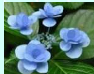
ボージーブーケシリーズ