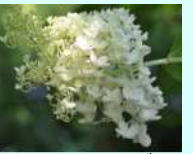
ノリウツギの園芸種