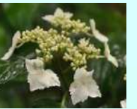
ベニガクアジサイ