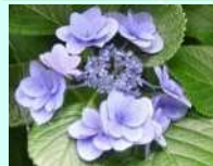
ボージーブーケシリーズ