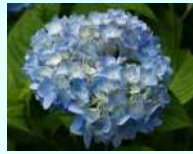
ブルダイヤモンド