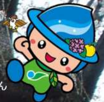
相模原市マスコット キャラクターさがみん