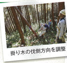
掛り木の伐倒方向を調整

作業地は、緩～中斜面のヒノキ林で、森林インストラクターの指導をうけながら、間伐作業に取り組みました。（参加74名）