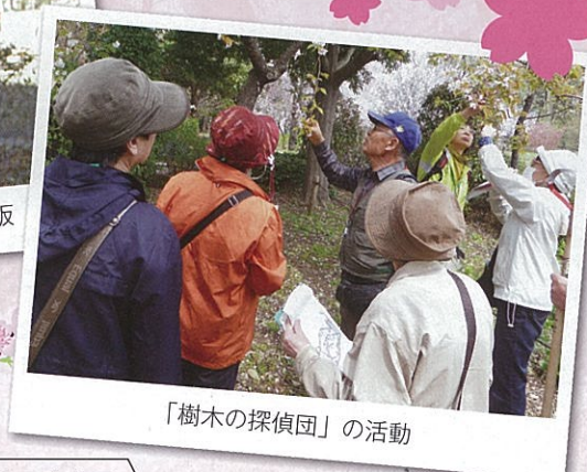
「樹木の探偵団」の活動