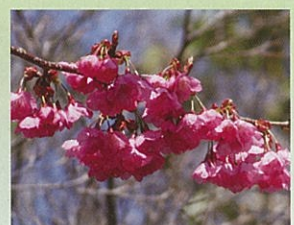
横浜緋桜 (ヨコハマヒザクラ) 4月上旬頃開花