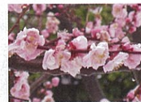
蝶の羽重 (チョウノハガサネ)