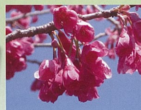
寒緋桜 (カンヒザクラ) 3月頃開花