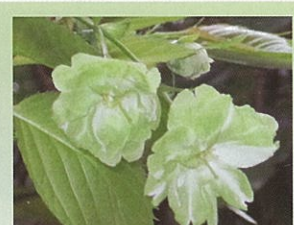
御衣黄 (ギョイコウ) 4月下旬頃開花