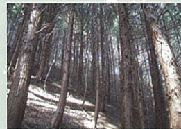
整備前のスギ・ヒノキ林 林床は暗く、木材の価値を 下げる小さな枝が多数ある。