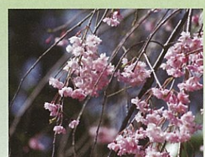
八重紅枝垂れ (ヤエベニシダレ) 4月中旬頃開花