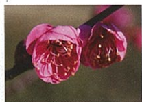
幾夜寝覚 (イクコネザメ)