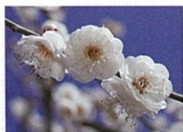
水心鏡 (スイシンキョウ)