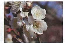
田子の浦 (タゴノウラ)