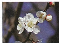
茶青花 (チャセイカ)