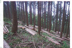
整備後 間伐や枝打ち作業に より明るくなった林床