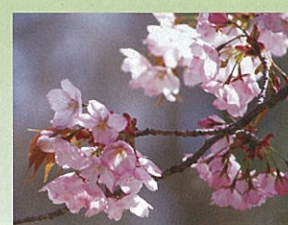
兼六園熊谷 (ケンロクエンクマガイ) 4月中旬頃開花