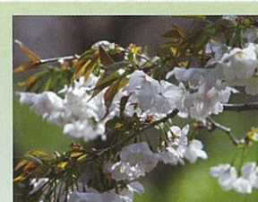
山桜 (ヤマザクラ) 4月頃開花