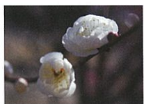
宇治の里 (ウジノサト)