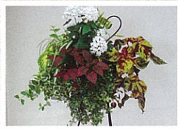
涼しげな夏向きのハンギングバスケットができあがりました