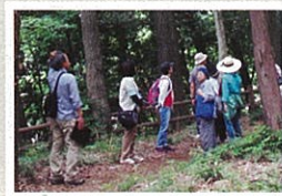
生態系としてのまともりや樹林の保全状態なども学び、環境保全への関心も高まりました。