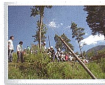
丸太の引き上げ作業