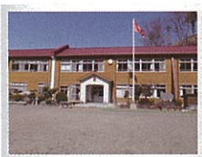
相模原市内唯一の木造小学校「青根小学校」