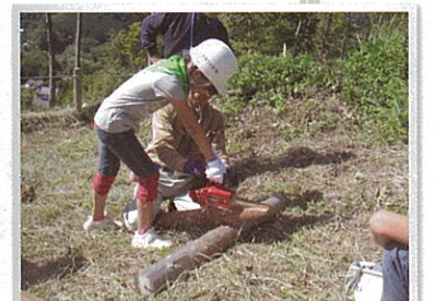
チェーンソー体験