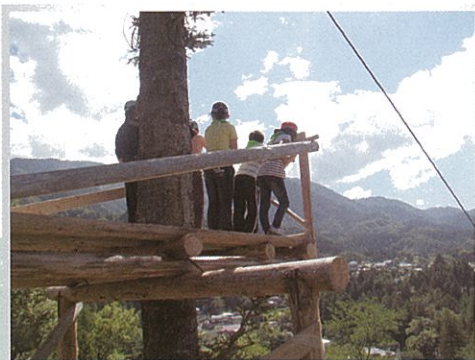
青根小学校林に作られた地元材を使った手作りの「ヤッホー台」 （「やまびこ」が返ってくるよ）