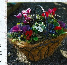
バラ咲きのP・ポリアンサとガーデンシクラメンの寄せ植え

花 色：赤・桃・黄・紫色など 咲き方：アコーリス咲き、バラソル咲きなど ポリアンサは花径5～6cmの花を咲かせ、最近は豪華なバラ咲き品種も多くみられます。バラの様に爽やかな甘い香りがします。ジュリアンはやや小さい花径4cm前後の花を咲かせます。