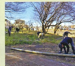
除伐した竹の処理