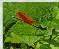
アサヒナカワトンボ

コカ・コーラ ボトラーズジャパン株式会社は、相模原市まち・みどり公社が推進する「みどり豊かなまちづくり」に協賛しています。