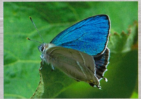
ハヤシミドリシジミ