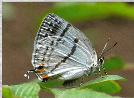
ミズイロオナガシジミ