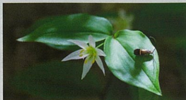
チゴユリとホソオビヒゲナガ