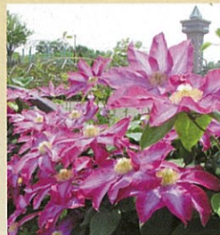
クレマチス 'ドクター・ラッペル'

また、同公園は5月頃から咲き始めるクレマチス（230種8,000株）や梅雨の季節の定番アジサイ（200種7,400株）が見どころでもあり、それぞれが咲く季節にはフェアが催され、大勢の来場者で賑わいます。