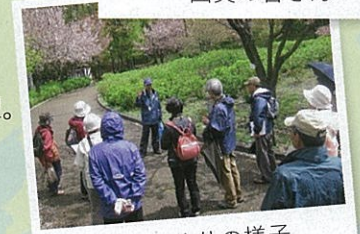
樹木めぐりの様子