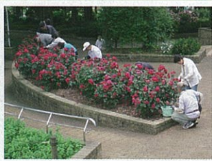
バラの手入れ（花殻摘み）