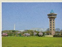
芝生広場と展望塔(右奥)