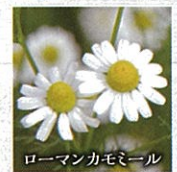
ローマンカモミール

りんごのような香り、優しく可愛らしい姿が印象的なカモミールですが、「お医者さんのハーブ」と呼ばれていて、元気のない植物のそばに植えると元気を取り戻させる効果があります。益虫を引き寄せ、蚊は寄せ付けなくする効果も期待できます。