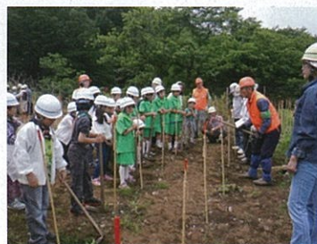
相模原市緑区鳥屋（植樹）

丹沢や箱根などを中心とした森林の保全を推進しています。財団が主催する森林づくり活動は、初めての方からベテランの方まで参加でき、NPO法人かながわ森林インストラクターの会などの協力を得ながら植栽、下刈、枝打、間伐などを行い、相模原市内では、年2回の活動を実施しています。皆様のご参加をお待ちしています。