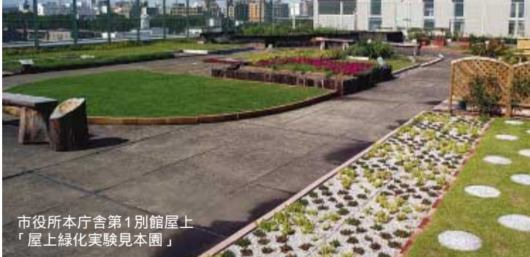
市役所本庁舎第1別館屋上 「屋上緑化実験見本園」

屋上緑化は、都市に新たな緑を創りだし、身近な暮らしに潤いを与えるものとして注目されています。今年5月に開園した実験・見本園の技術やしぐみを知っていただき、将来の快適な都市環境を考える機会にはいかがですか。