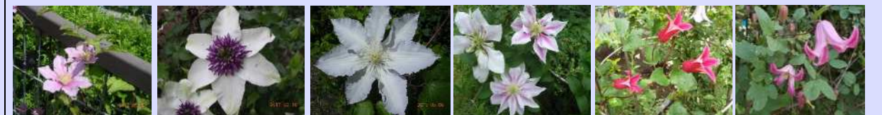
かぐや テッセン ジリアンブレイズ アンドロメダ プリンセスアイナ 踊場 など