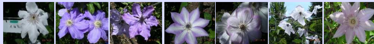
武蔵野 HFヤング ムサシ 紀三井寺 ドーン アルパラジュリアス ミス東京 など