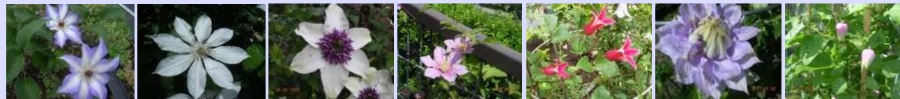
美佐世 相模原のかげグマ テッセン かぐや プリンセスアイナ ヘルムウッキング 這沢 など

風のガーデンは、相模原クレマチスの会（麻溝公園ボランティア団体）が管理しています