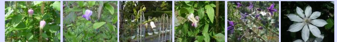
這沢 リトルベル董 カイウ テキセンシスM 龍安 相模原のかげグマ など

フィールドアスレチック外周フェンス沿いには多数品種を100m以上のフェンスに植栽しています