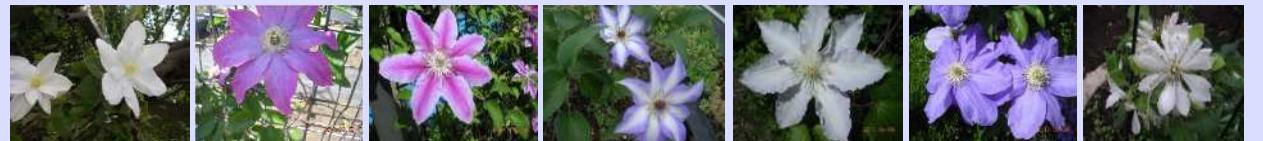
都築 柿生 ドクターラッパル 美佐世 ジリアンブレイズ HFヤング 雪おこし

フィールドアスレチック外周フェンス沿いには多数品種を100m以上のフェンスに植栽しています