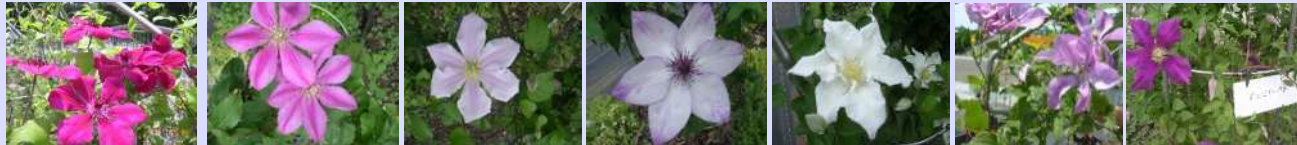
アラーナ トリーヌ 桜吹雪 フォントメリー サーロモン マーガレットハート ジュビリー70 など

風のガーデンは、相模原クレマチスの会（麻溝公園ボランティア団体）が管理しています