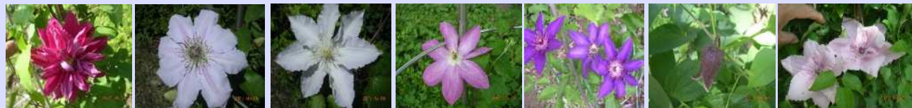
赤富士 フェアリークイーン ジリアンブレイズ 麻生 マリアイザンセン フスカ ピンクファンタジー