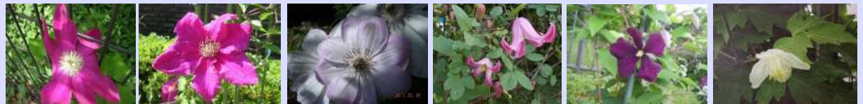
星のフラメンコ クリムゾンキング ドーン 踊場 エワムイレット 白花ハシヨウカ など