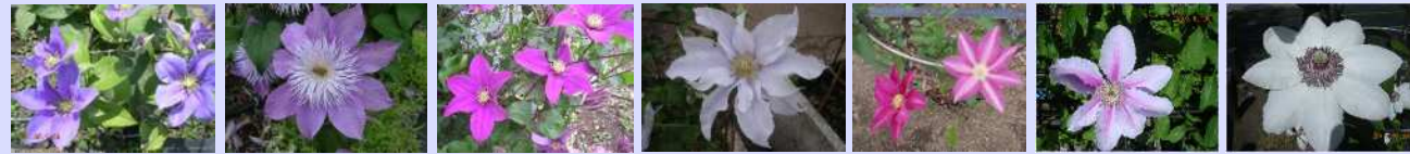
藤娘 フェアリーブル 楊貴妃 朝霞 八橋 ビーズジュビリー 華燭の舞