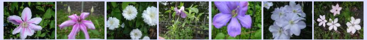
ビーズジュビリー ジョウウォレン ダッチオブイジパラ パティゴング ミセスチムリー ルイーズロー 薄墨